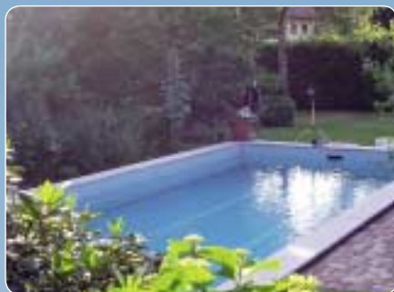
Piscine privée, 80 m 3 Allemagne