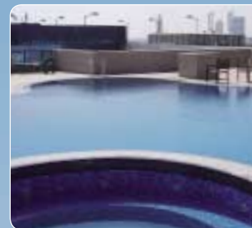
Piscine publique, 140 m 3 , Dubaï, EAU