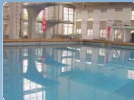
Piscine publique, 2500 m 3 , Taiwan