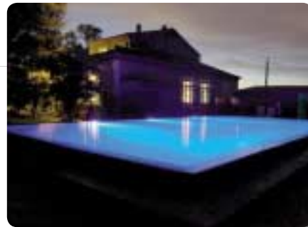
Piscine privée, 160 m 3 , France