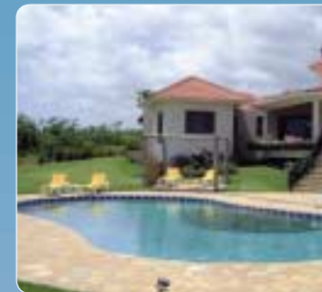
Piscine privée, 80 m 3 , République dominicaine