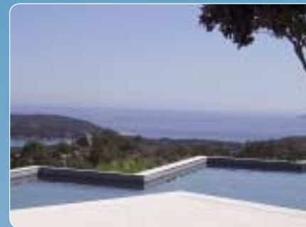
Piscine privée, 400 m 3 , Corse