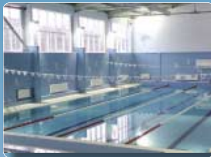
Piscine publique, 400 m 3 , Moscou, Russie