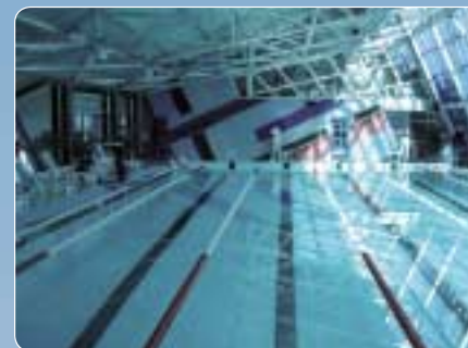
Piscine publique, 450 m 3 , Kazakhstan