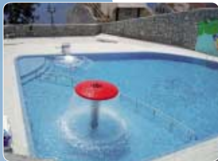
Piscine publique, 300 m 3 , Crimée, Ukraine