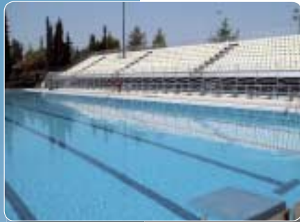
Jeux olympiques d'Athènes 2004, 3000 m 3

Vous trouverez d'autres références sur notre site Internet www.necon.de